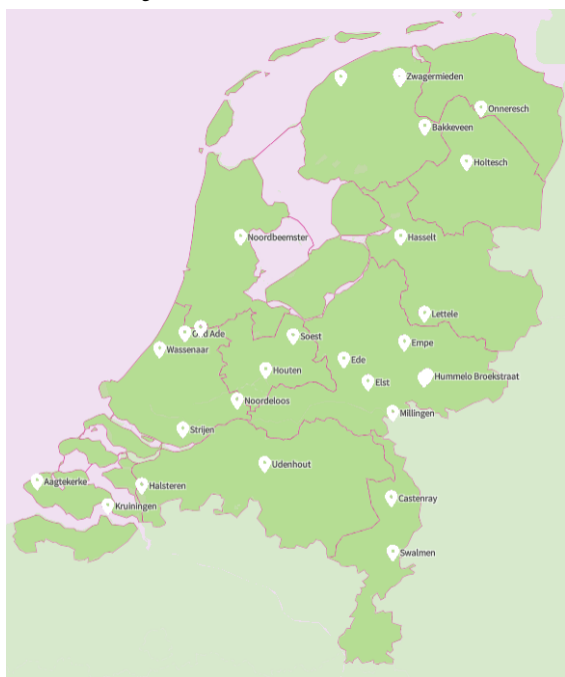
afbeelding 1: Land van Ons heeft inmiddels percelen door het hele land (situatie december 2025) 3

Als een perceel grond is aangekocht wordt er een boer bij gezocht. „Samen met de boer maken we duurzame keuzes in wat betreft het gewas, de manier van beplanten, de inrichting en het beheer van de akkers. Op deze manier ontstaan weer meer plekken waar een rijk bodemleven is en beschutting voor allerlei soorten planten, dieren en insecten. Door de akkers te voorzien van bomen, hagen en struwelen wordt ons landschap diverser en kun je je weer verwonderen over wat je ziet.“ aldus Land van Ons.