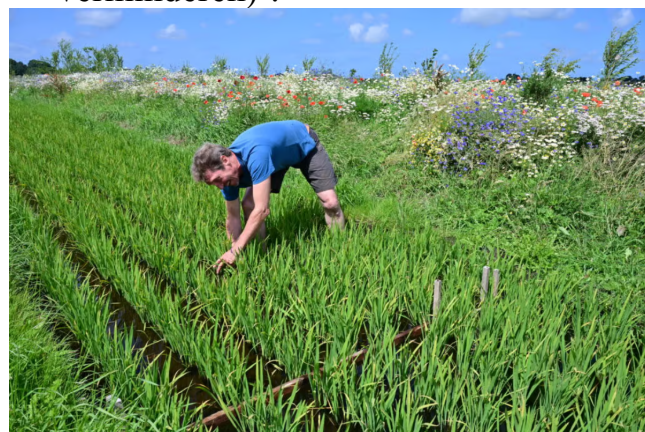
rijstteelt in Oud Ade