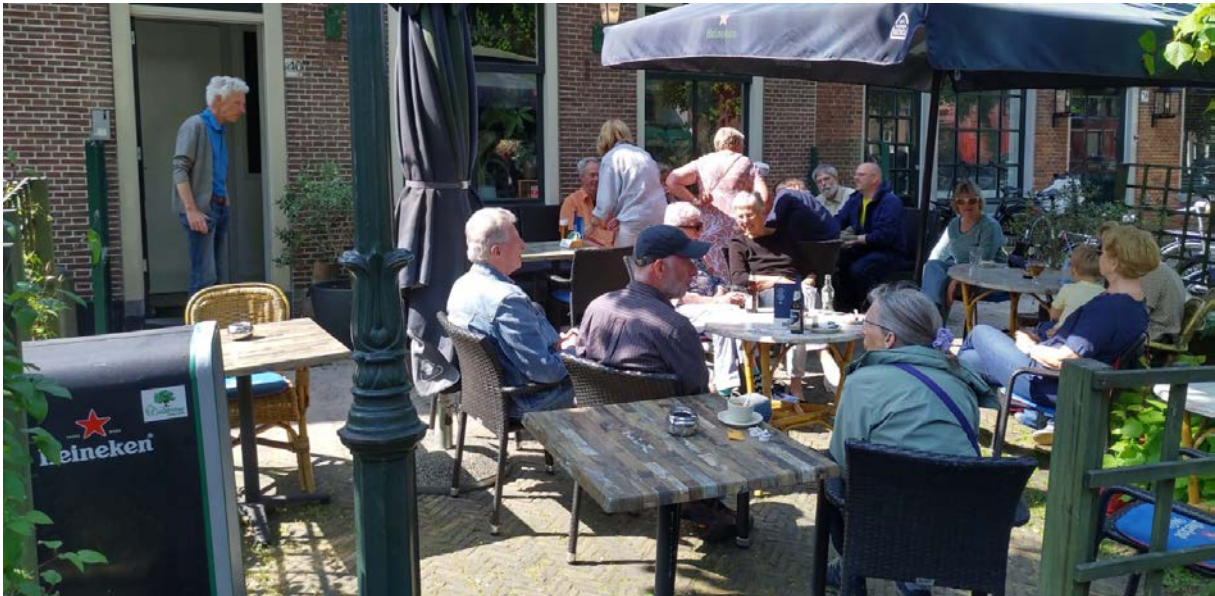
De Groene Borrel op 27 mei op het terras van de Lindeboom

De Groene Borrel die GroenLinks Voorschoten een aantal maal per jaar organiseert is leuk en een succes. GroenLinksers ontmoeten en spreken elkaar onder het genot van een drankje. Dat is leuk en gezellig en het is goed elkaar eens ongedwongen te ontmoeten. We gaan er zeker mee door.