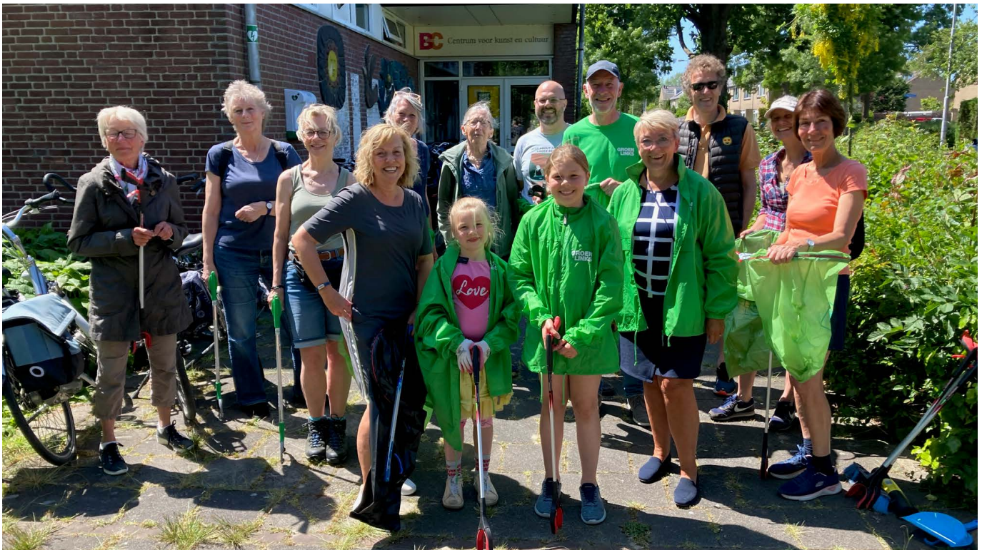
Opruimactie van GroenLinks Voorschoten , 3 juni 2023

door samen te werken en lokale initiatieven op te zetten. Door actief deel te nemen aan dergelijke initiatieven kunnen burgers een positieve impact hebben. Hebben jullie nog voorbeelden?