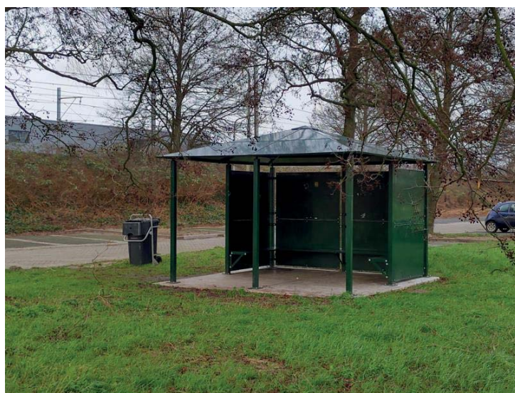
De nieuwe JOP

jongerenwerkteam heeft dat zeer actief en vol passie met de Voorschotense jongeren bezig is, geeft dat al aan. Wij als jongerenwerkers zorgen ervoor dat we sterk betrokken zijn bij lokale akkoorden zoals het Sportakkoord, maar zeker ook bij het preventieakkoord. Hierbij werken we met vele partijen samen om de jongeren in het zicht te houden. En daarnaast ook in beweging, weerbaar en gezond. Dit zal nog beter gaan nu we een jongerenactiviteitscentrum hebben (de Groene Kikker). Maar dat is slechts één van de voorwaarden om als jongerenwerk goed ons werk te kunnen doen. Aan al die voorwaarden wordt samen met onder andere de gemeente hard gewerkt. De jeugd moet immers een toekomst hebben in Voorschoten.