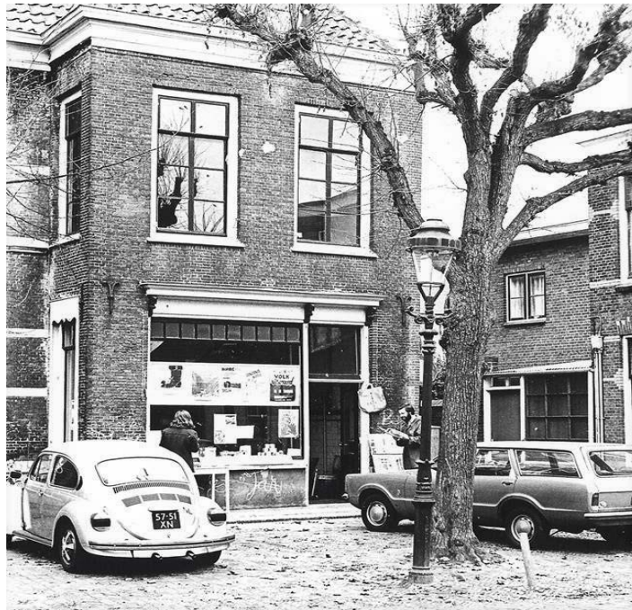
de wereldwinkel rond 1970

wordt voldaan? En krijgen die erven het pand dan wellicht terug? Ik zou het me zomaar kunnen voorstellen.